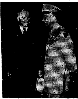
EISENHOWER Y TRUMAN