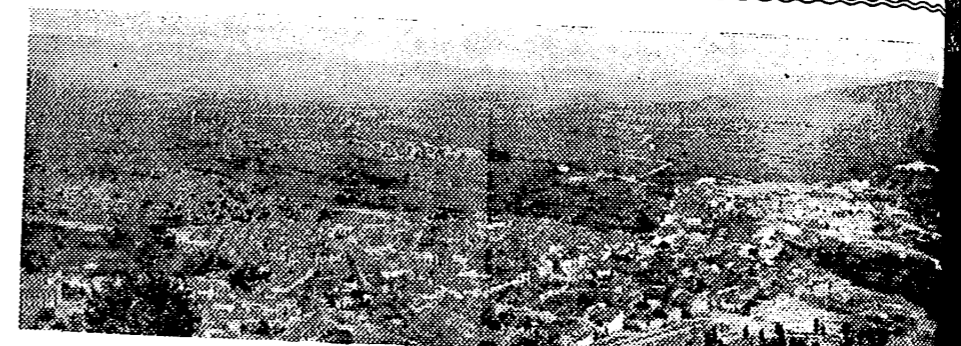
UNA VISTA GENERAL DE ALCORA

ascur de oro la bellísima imagen de la Virgen de la Asunción, sobre el petre alto del Barrio nuestro Cristo del Calvario con la faz dulce y serena del Hombre-Dios que quiere de su vida para redención de la humanidad y los brazos extendidos queriendo abrazar al mundo con un amoroso abrazo; suena el organo jerrando la suaves y armoniosas notas de una marcha, mientras atraviesan la puerta de entrada las elegidas, con sus trajes típicos y bandas distintivas; evamos brazadas de flores que de dos en dos, van depositando arrebatadas a los pies y ofreciendo una gran corbille de flores. Tierra y emoción cremona que Alcora