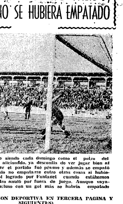
El Estadio sigue siendo cada domingo como el pulmón del castellano. Anteayer el partido fue polémico y además se empató con el Jerez. Pudo no empatarse entre otras cosas si hubiera valido este gol logrado por Fontanet cuando estábamos 1-1 y el árbitro anuló por fuera de juego. Aunque vayamos a saber si incluso con un gol más se hubiera empatado.