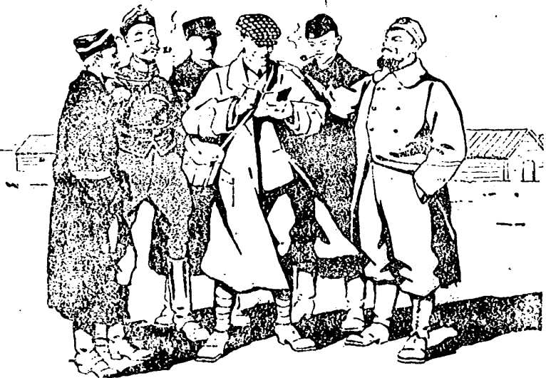
Un reportero holandés interrogando a los prisioneros del campamento de Harderwyk.