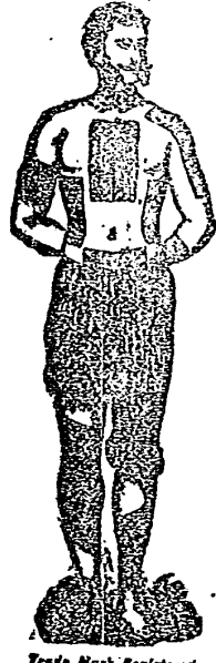
Los emplastos de feltro rojo, del Dr. Winter, son los únicos verdaderos y eficaces. Cuidado con las imitaciones. Exíjanse siempre la marca del Dr. Winter.

Curan reumatismo, resfriados, dolor de riñones, dolor de espalda, dolor de pulmones, lumbago, ciática, contusiones, etc., etc.