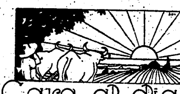
Gara al día

Respetar su derecho —responde el régimen— garantizarlo en las leyes, esas varas son pocas, pero de estímulo al Poder y sus mismas censuras, impuestas, y si fueran muchas, ellas irían entonces el haz, sin otras ligaduras, la libre adhesión popular a la respuesta de la razón.