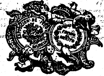
DIPLOMA DE HONOR Y MEDALLA DE PLATA