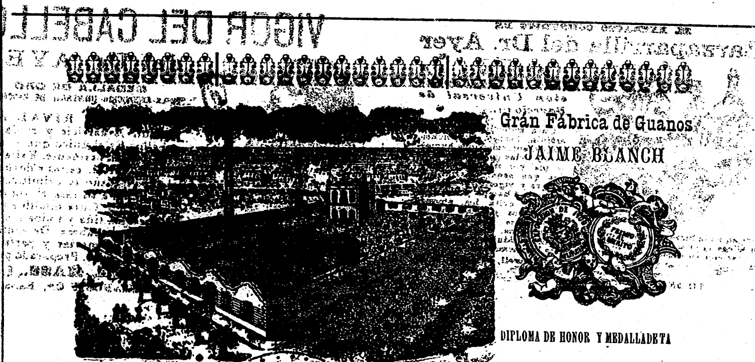
Gran Fabrica de Guanos JAIME BLANCH

Buenas casas de hospedaje, habitaciones expresas para epurados y carruajes diarios desde Tortosa, Santa Birba, Ulldecona y Vinaroz á La Cenia.