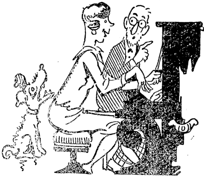
Las lecciones musicales

—Esta composición debe ser muy lenta, con mucho sentido. —Esto me aburre. Si aprendo a tocar el piano es porque el perro ladra, grito mi padre y chillan los vecinos.