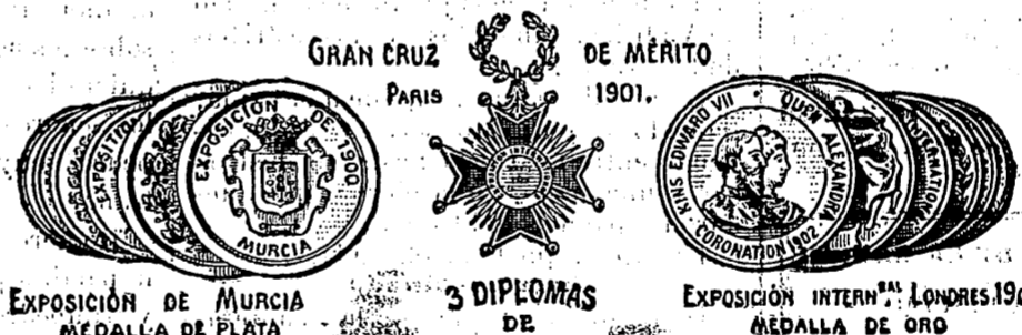
EXPOSICIÓN DE MURCIA MEDALLA DE PLATA

Exportación en provincias y las américas. EXISTENCIA PERMANENTE 10 000 metros cuadrados