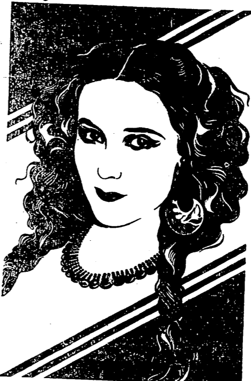
Dolores del Río, protagonista de «La Paloma», película filmada en español