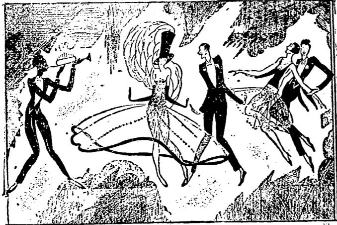
El juicio final —¿Me quieres decir qué baile es éste? —Mira chicas, el del juicio final.

el camión UNIC se desliza sin contratiempo ni molestia. rápido - fuerte - seguro - económico e. dávalos masip - castellón - calle cajal, 3