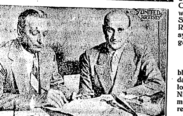
Goldwyn y Florenz Ziegfeld, el creador de las grandes revistas de Broadway