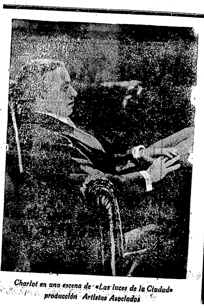
Charlot en una escena de «Las Luces de la Ciudad» producción Artistas Asociados