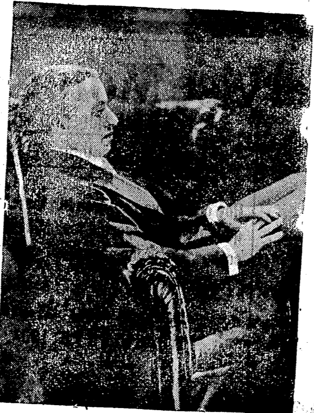
Charlot en una escena de «Las Luces de la Ciudad» producción Artistas Asociados