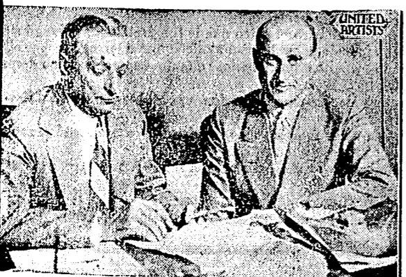
El Goldwyn y Florenz Ziegfeld, el creador de las grandes revistas de Broadway

Recibimos propuestas innumerables para usar los muebles que he usado en ciertas películas, «incluyó Willis», pues los coleccionistas reconocen desde su asiento el valor de las piezas, pero nunca nos deshacemos de ellas».