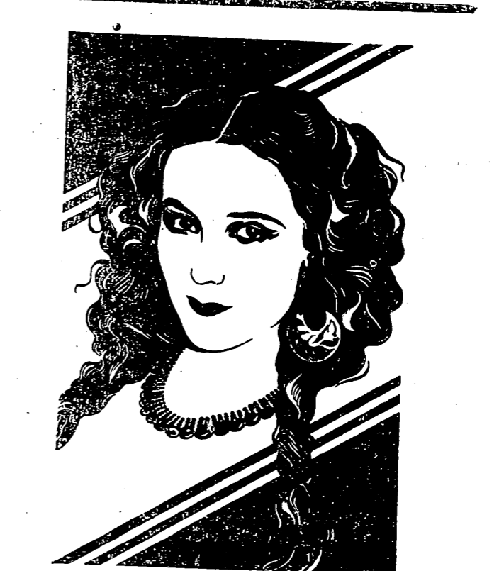
Dolores del Río, protagonista de «La Paloma», película filmada en español