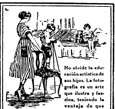
No olvide la educación artística de sus hijos. La fotografía es un arte que ilustra y fascina, teniendo la ventaja de que puede desarrollarse sin molestias ni aprendizaje, empleando el sistema KODAK. Las pequeñas fotografías familiares de hoy serán tesoros mañana.