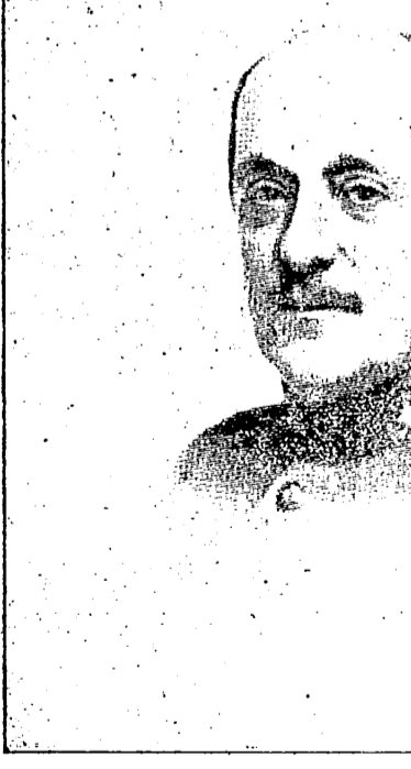
El Excmo. Sr. Duque de Tetuán, conde de Lucena ministro de la Guerra, general O'Donnell

El recibimiento dispensado al general O'Donnell, ministro de la Guerra, en Castellón, ha sido el más espléndido que se haya visto en esta ciudad. El general O'Donnell, ministro de la Guerra, en Castellón, ha sido el más espléndido que se haya visto en esta ciudad.