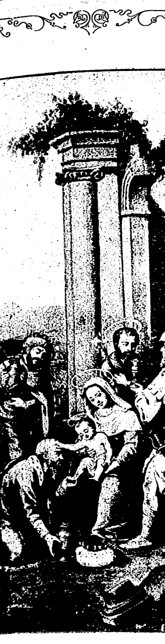
Capilla de los Santos Reyes, Iglesia Parroquial de Castellón