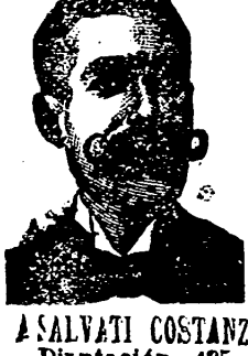
A. SALVATI COSTANZI Diputación, 435, Barcelona