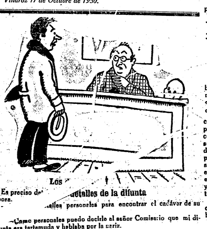
Es preciso de... detalles de la difunta... personas para encontrar el cadáver de su... Como personas puedo decirle al señor Comisario que mi difunto era tartamuda y hablaba por la nariz.

Una bella «Página sanitaria»—La escuela del paseo de Ribalta—inserta en HERALDO del día 15; otra página sugestiva «La escuela y la delincuencia», artículo que publica El Sol en la misma fecha y otra página emotiva, «El derecho a la instrucción»—A la puerta de la escuela—que ve la luz pública en El Pueblo correspondiente al día de hoy, divergen en la forma de pedir, convergen, como terapéuticas, al formular la profilaxis social a seguir en los cuidados que demandan los ciudadanos de mañana, colaborando en la magna cruzada que apasionadamente predica Luis Bello, para que se atiendan debidamente «los derechos del niño» y no sean insuficientes los preventorios para delinquentes infantiles y sea menor la depauperación de la raza, el terrible mal de la ignorancia, etc. Manuel Such, Matilde Huici, Luis de Zulueta, con su saber y su prestigio, señalan caminos y en el ágora de que hoy se dispone, levantan su tribuna y revestidos de la toga, defienden los derechos del pueblo. José Sánchez Asensi. Vinaroz 17 de Octubre de 1930.