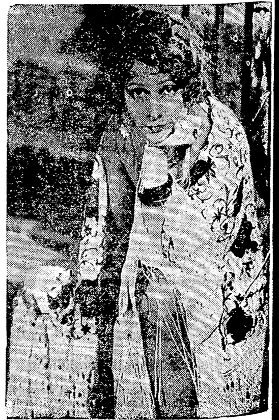
La encantadora Norma Talmadge que recientemente visitó España en una interesante escena de «La mujer disputada», película que presentan «Los Artistas Asociados» y que se estrenará en el P...

Gran Hotel de primer orden: ensija completa, de 16 a 26 peretas Nuevo Hotel desde 11 Régimen para enfermos CHALETS. - CASITAS INDEPENDIENTES Completamente amuebladas, desde 4'50 a 30 pesetas diarias. Se alquilan en cualquier época del año. Magistral servicio diario de automóviles directo de Valencia al Balneario, que salen a las 3'30 de la tarde llegando a Hervideros alrededor de las siete de la mañana INFORMES, Mar, 60 Teléfono número 11.205 VALENCIA