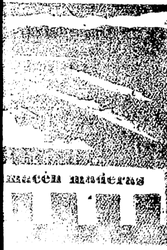
Completo surtido en barras de bayapine... Móvil, plus rojo y blanco Canadá etc. Precios sin competencia.