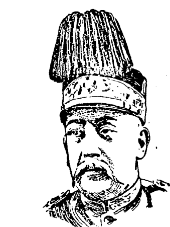
Juan Si Kai, presidente de la república china que acaba de fallecer.