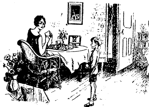
El despertador de p'és

—¿Para qué quieres el despertador, hijo mío? —Para llevárselo al abuelito que dice que se le han dormido los pies.