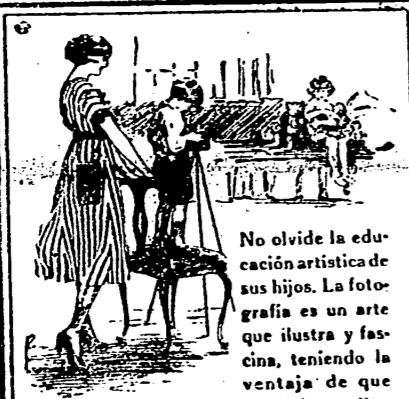
No olvide la educación artística de sus hijos. La fotografía es un arte que ilustra y fascina, teniendo la ventaja de que puede desarrollarse sin molestias ni aprendizaje, empleando el sistema KODAK. Las pequeñas fotografías familiares de hoy serán tesoros mañana.

Todo Castellón puede vestir bien y con poco dinero. No dejéis de visitar esta casa. ES LA QUE VENDE MAS BARATO QUE NADIE.