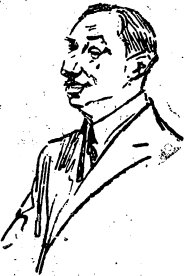
D. José Yanguas Messia, Presidente de la Asamblea Nacional que contraerá matrimonio pasado mañana en la Corte. P. C.

Con este portuñesismo en la confección de los programas, es con el que no estoy conforme, como no puede estarlo tampoco con las fiestas, no estamos que turbó el reposo del vecindario porque las fiestas deben ser de tal índole, que todo el que quiera pueda tomar parte en ellas, sin que causen molestia al que por sus ocupaciones necesita el descanso o el que por hipocresía es poco propenso a las diversiones. Y claro está que no me refiero a la celebración de la fiesta de la Rosa, fiesta poética y ga-