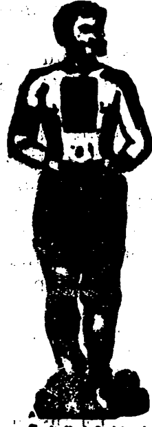
Los emplastos de bayeta roja, del Dr. Winter, son los únicos verdaderos y eficaces. Colócalos con las indicaciones. Enjuágalos siempre en agua fría. Úsalos como por encima. Botones y Droguerías

Curan reumatismo, resfriados, dolor de riñones, dolor de espalda, dolor de pulmones, lumbago, ciática, contusiones, etc., etc.