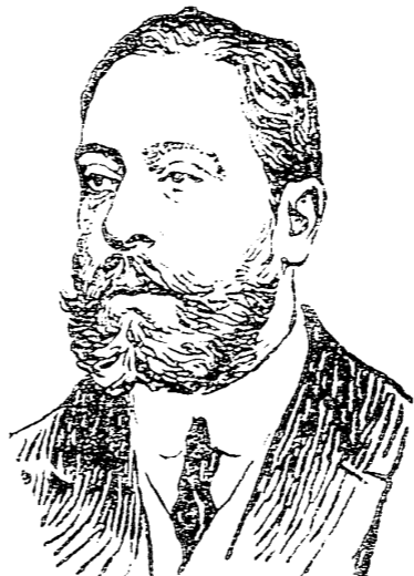
D. Julio Barali, ex ministro de Instrucción Pública fallecido recientemente.

—¿...? —¿Imposible! Con monarquías, ¿cómo encontrar la libertad individual teniendo en frente al gobierno civil? ¿Cómo hablar de autonomía municipal sin ver los trabajos que son para ellas las Distintas y los gobernadores? Hay que ver