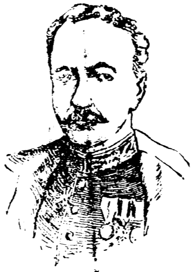
Sir James Murray, nuevo jefe del E. M. del ejército inglés.

meledoras de toda confesión dogmática. Su ilustre nombre le facilitó los medios de conocer a fondo la alta sociedad francesa. Entre otras obras escribió la tragedia «Edipo», «Cuentos», «Epigramas», «Sátiros», «Biblia comentada», «Mahoma», «Zaira» y «Cándido». Esta última le dio fama universal, por su dialéctica arumata y su punzante sátira contra el desafuero y el fanatismo. (1694-1778.)