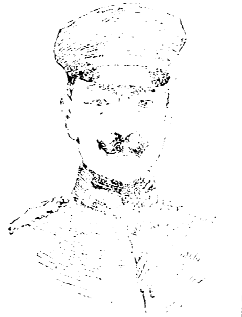
General von Lantieri, comandante de las tropas alemanas que operan en las provincias rusas del Báltico.

Sobre el telégrafo tiene el aparato mencionado, la imponderable ventaja de la rapidez y la de que sus signos son los mismos de la escritura común.