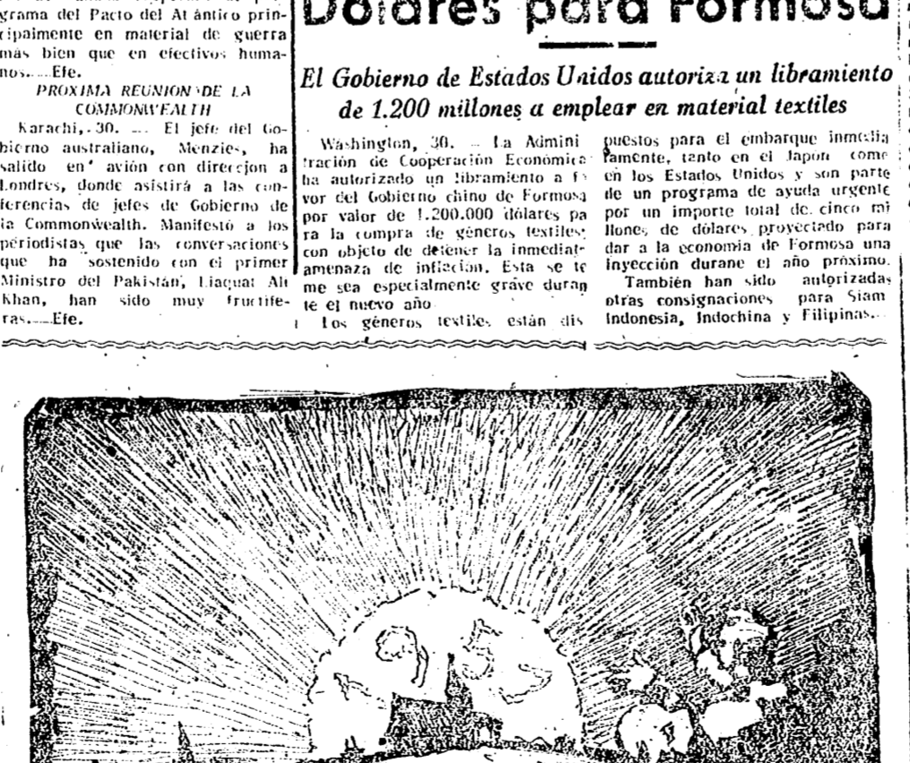
DIRJASE A LA OBRA SINDICAL DEL HOGAR Y TENGA UN FELIZ AÑO 1951 EN LA VIVIENDA SANA Y ALEGRE QUE LE CONSTRUIROS.

Barcelona, 30. — El General Thorp, diputado conservador y miembro de la Cámara de los Comunes Ingleses. En sus manifestaciones a los periodistas ha hecho constar que visita España para conocer de cerca la realidad del momento actual de nuestra Patria en lo que se muestra sumamente interesado. Subrayó su oposición a la política antiespañola del gobierno laborista por considerar que la justa posición y actitud de los gobiernos contra España, máxime en su contraste que suponía antes de la guerra, cuando el sistema británico como se daba primacía a Rusia y demás países satélites de ella con amenaza de los buenos principios de nuestra civilización en los que España siempre ha estado en vanguardia de la libertad y la justicia. —Etc.