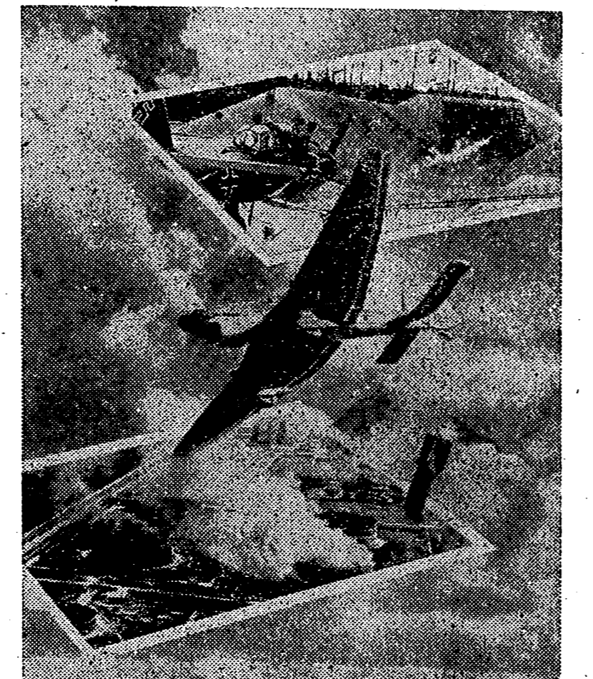
En la primera foto, los pilotos alemanes se ejercitan en el manejo de la ametralladora tirando al blanco; en la segunda, un "Ju 87", con truído espelmonte para bombar los en picado, ataca los depósitos británicos de gasolina

La Misa Coral Compostelana, que había su aparición por primera vez hoy, después de una suspensión de largos años, cantó el "Ave María" del Maestro Vitoria y la Misa del Ángelus, del Maestro Valdés. — Cifra.