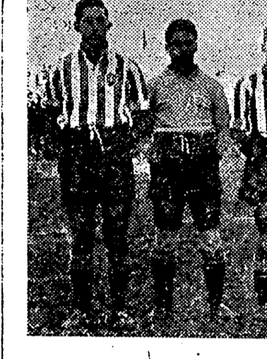
Los debutantes del domingo

Los equipos, a las órdenes de Ocaña, se alinearon así: Oviedo. — Lorente; Fernández, Peña, Granda, Diestro, Siro, Antón, Alcalde, Echevarría, Herrerrita y Emilin. Castellón. — Higinio; Mauri, Allepez; Madurga, Burcel, Santolaria; Arnau, Soria, Ricart, Doménech y Pizá. Sale el Castellón lanzado en tromba sobre la puerta contraria; la pelota va a Soria y cuando éste se dispone a driblear a Diestro el medio centro asturiano le derriba; saca la falta Madurga, bombeando sobre la puerta en su lado izquierdo; Doménech entra decidido y de un formidable remate de cabeza marca un tanto imparable cuando aún no ha transcurrido un minuto de juego. El Sequiol arde por los cuatro costados y el público se levanta en pie al hacer una carrera Pizá con pa-larza a Ricart; éste la toca suavemente y le envía a Arnau que, sólo, corre y llega al área chutando — batiendo a Lorente por segunda vez antes del segundo minuto; aunque el señor Ocaña anula el tanto por un discutible fuera de juego, el público comprende que este Castellón de hoy es distinto al de otros días y aplaude con gran entusiasmo y el equipo sigue avanzando una y otra vez de interior perfecto que da infinidad de balones a los extremos y que permite a Ricart desenvolverse con gran soltura y