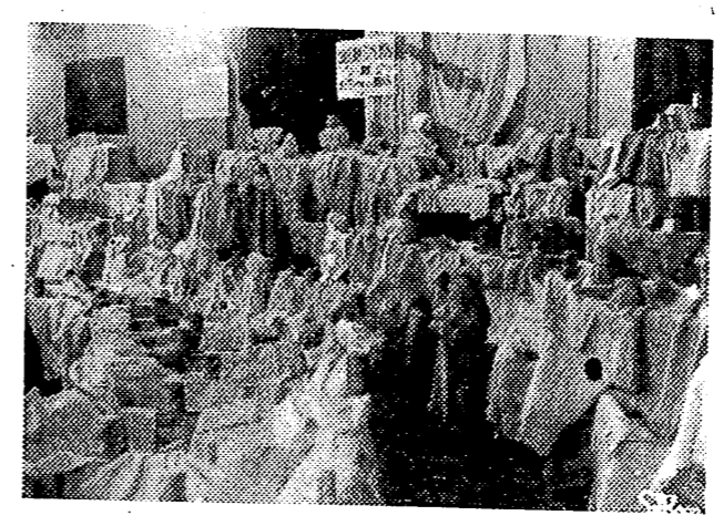
Trescientas cunas y otros tantos equipos para recién nacidos figuran en la exposición de la Sección Femenina. Ante ellos comprueba el público la gran labor de nuestras camaradas, solo parcialmente expresada en esta sugestiva exposición.

Estos días los amplios ventanales del salón de actos de la C. N. S. recayentes a la calle de José Antonio, se hallan casi siempre con un apretado público que se acerca atraído por el aspecto del salón en el que se apilan, en un orden que no puede evitar esa impresión del gran número de elementos expuestos, las cunas y los equipos para recién nacidos que la Sección Femenina va a entregar a los matrimonios modestos que esperan la bendición de un hijo. Y en ese público que admira los preciosos artículos allí reunidos, surge una exclamación de satisfacción unánime: "Esto sí que está bien". Nosotros, por nuestra parte, podríamos añadir que está bien todo lo que hace la Sección Femenina, aunque otras tareas no tengan una exposición que cautive al público como esta que ahora Castellón conoce como un motivo de orgullo propio.