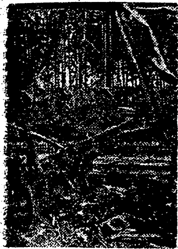
Un tren militar soviético fué descubierta por los aviones alemanes en la retaguardia roja, y en este caso quedó tras la rápida intervención de los cazas soviéticos.

REUNION PROHIBIDA Buenos Aires. — El Gobierno ha prohibido al partido socialista la celebración de una reunión en la que iba a ser examinada la política internacional argentina. — Efe.