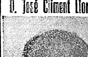
(PRESIDENTE DE LA SECCION SOCIAL DEL SINDICATO PROVINCIAL DE LA CONSTRUCCION, VIDRIO Y CERAMICA)