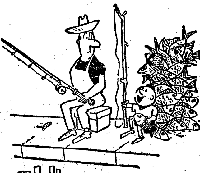
—Yo de usted, probaría con un alfiler...