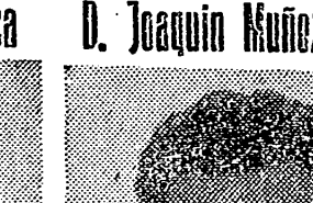
(PRESIDENTE DE LA SECCION ECONOMICA DEL SINDICATO PROVINCIAL PIEL)

Es Vicepresidente del Sector Industria del Consejo Económico Sindical de Castellón.