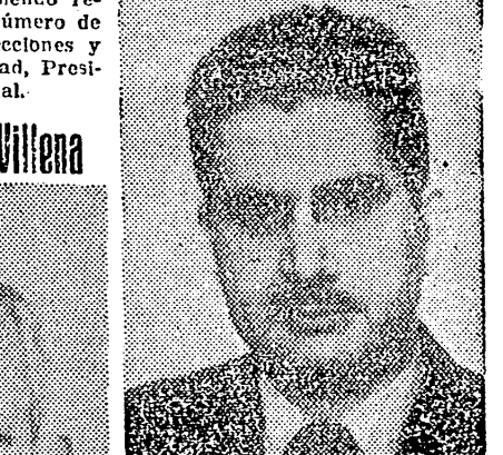
(JEFE DEL SINDICATO PROVINCIAL DE BANCA Y BOLSA Y JEFE Y PRESIDENTE DEL SECTOR SERVICIOS DEL CONSEJO ECONOMICO SINDICAL PROVINCIAL.)

Es Vicepresidente del Sector Servicios del Consejo Económico Sindical de Castellón.