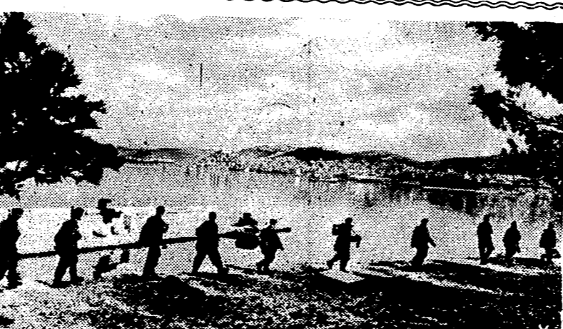
Después del armisticio de Italia, las tropas alemanas ocuparon rápidamente la península itálica y ocuparon posiciones vigilantes en Dalmacia, en previsión de un intento aliado en esta región. Un destacamento germano realiza un servicio en la costa dálmata.

Estaba defendida por tropas de Badoglio.