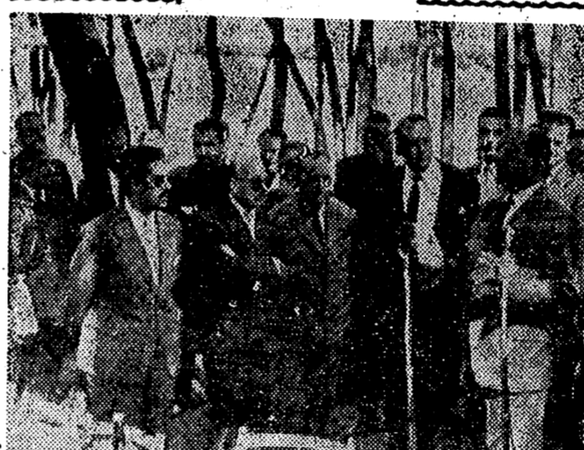
GRANADA. — Discurso del ministro Secretario General del Movimiento, Sr. Solís, a los alféreces provisionales, llegados de toda España, para ofrendar la insignia de Madre de Alférez Provisional Caldo, a la Virgen de las Angustias, durante la concentración celebrada en el panteón de Alcázar, donde se celebró un rancho de campaña. (Foto. Cifra Gráfica).

PARIS, 29. — A las ocho en punto de la mañana, con un tiempo generalmente bueno en toda Francia, abrieron los colegios electorales, siendo de destacar la escasez de atentados terroristas en la última noche antes de la crucial votación de hoy. Cuando el referéndum haya terminado esta noche, unos cuatro millones de franceses habrán depositado su "sí" o "no" a la nueva Constitución que abre paso a la V República francesa. El buen tiempo se cree contribuirá a hacer más copiosa la afluencia de volantes. Todos los pronosticos coinciden en afirmar que la solución afirmativa alcanzará de un 60 a 70 por 100 de mayoría. — Efe.