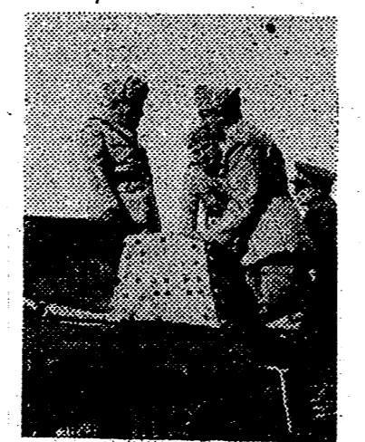
En una población de la Italia Central, el Duce Benito Mussolini asiste a unos ejercicios realizados por las formaciones acorazadas del Ejército fascista.

El Instituto Nacional de Industrias dependerá de la Presidencia del Gobierno. — Cifra.