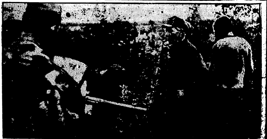
Ultimamente parece que las bandas soviéticas de Bosnia han sido casi totalmente aniquiladas por las formaciones italo-germanas, que en la foto están interrogando a unos prisioneros.