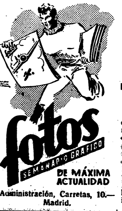
DE MÁXIMA ACTUALIDAD Administración, Carretas, 10.— Madrid.