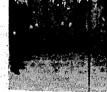
Grupo de concurrentes a la inauguración de las nuevas Oficinas Centrales "GALINDO"

Este acontecimiento de la vida industrial barcelonesa, se celebró el día 15 de los corrientes a las 6 de la tarde. Mucho antes de la hora señalada, co-