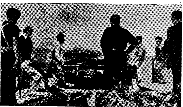
Liberado Alicante, la Falange fué devotamente a recoger los restos de José Antonio, apilados sobre el fondo de la tumba por los cuerpos de falangistas y requetés que unieron la suya a la sangre del Fundador. Y ante la emoción de los que en vida le siguieron, José Antonio, vencido por la muerte, pasa a la Capilla que manos de mujer le preparó en la que fué cárcel.

En Cu y d de m EL Como lugar de la doctrin llega al p mentos d pero cuat to y su nublados vidista. ción inme rie de ten leza que ligencia d anunciab terpretaci daban a aparición De mon tud la qu posición d tro del m niol y ella menció a aquello t partido p los jóvene teranos d derechista Falange, u comprende la realidad dadera Re social pod ante la su que amen do y ot pretendie cer el run con el Falange choque en turas inju dieron col bandera. Pero ac meros ins lucha en flancos — recibió at obligó a l colaborad te labor definición doctrina d posiciones en su ve clara y mente ext acción de e todos l era y que José A cierta oca defecto e intuición filas que de cosas mente ha vado; m ganándose dido la F ella para co tiempo