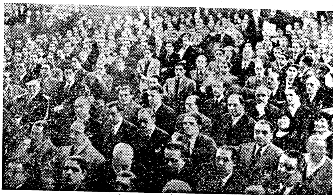
En el acto fundacional las palabras de José Antonio, presentación a España del nuevo afán y del fervor de la Falange, una multitud escuchó al Fundador y comprendió cómo por vez primera era la Patria lo esencial y la justicia lo primero a defender con aire resuelto y decidido.

Así, llegamos a Octubre de 1933 con el gesto triste, agrio —al decir de sus mismos defensores— y rencoroso acentuado en el régimen republicano que administraban los socialistas y comenzaban a amenazar con el potencial a la corriente más extrema revolucionaria; y así, hasta entonces lo que en lo político y económico había sido un torbellino y desorientación comenzaba a transformarse en