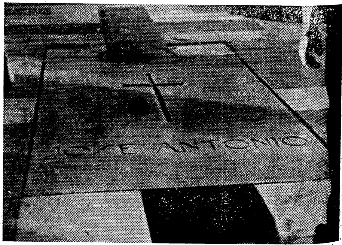
Franco otorgó a José Antonio la Palma de Oro por su sacrificio y quiso que los restos de quien inició el 29 de Octubre la lucha de la Falange reposaran en El Escorial, expresión de la grandeza de España que él tanto amó. Allí vuelven su mirada los falangistas y su voz resuena en todos los ámbitos: ¡JOSE ANTONIO, PRESENTE!