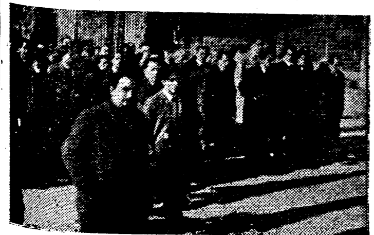
La juventud, generosa, ha escuchado el llamamiento de la Falange y sabe entregarse al servicio de España sin miedo y sin tasa. Con camaradas pero otros se alinean ante su tumba y prometen, con el jefe al frente, morir por el mismo ideal. Y en lo alto, las estrellas, recuerdan el sacrificio de nuestros mejores.