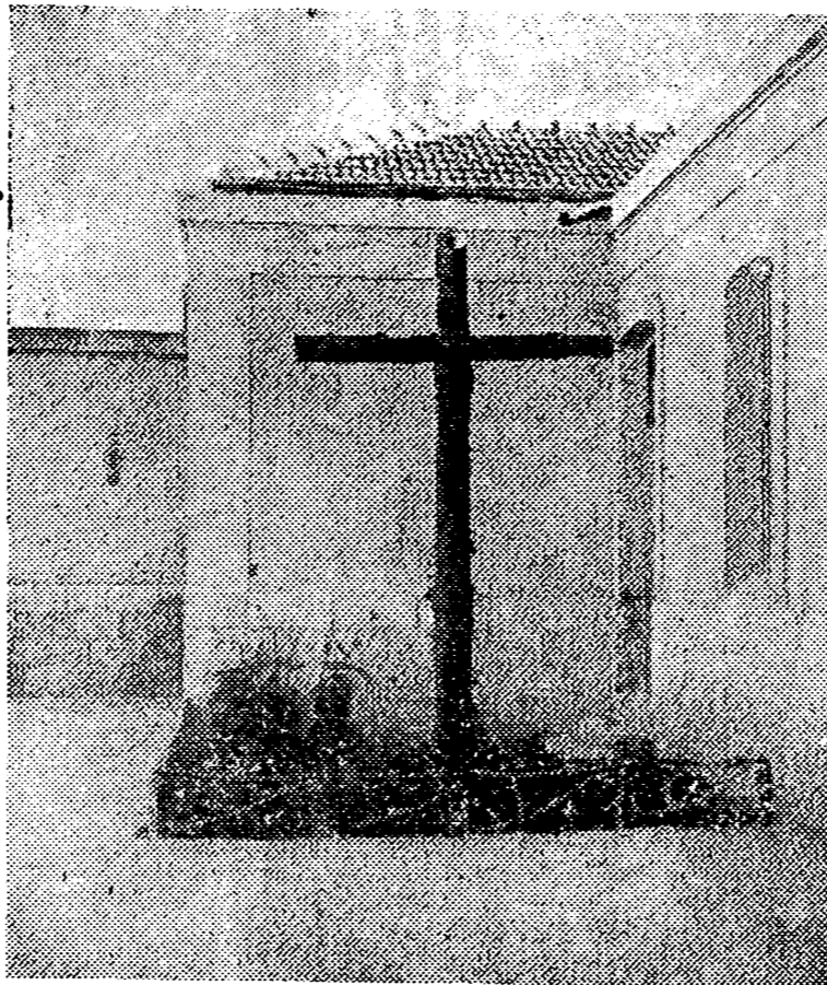
Una fría mañana de noviembre de 1936, José Antonio llegó al patio de la prisión de Alicante y se alineó, firme y alegre, contra esta pared. Rezando había recorrido los pasillos de la cárcel y rezando esperó que la descarga criminal truncara su último arriba España y cerrara sus ojos que miraban al cielo.

La guerra de liberación tuvo a Franco como mano ejecutora y a José Antonio como continuo acicate. Los combatientes, en los momentos duros de la lucha, le llevaban en su pensamiento y, movidos por su memoria, iban impelidos hacia el triunfo. Recordamos aquellos primeros meses de angustia infinita en que la suerte de España era un albur cuya solución estaba prendida y subordinada a la constancia en el