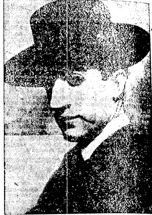
hombres que han marcado un verdadero hito en la historia de la fiesta, consiguieron alcanzar su significación en el torero.

Antes y después de Manolete, la fiesta fue y es grande, pero no había sido, tal vez según lo que estamos pudiendo evocar, como fue con Manolete. El día de una plenitud nueva, un momento de plenitud, una época en la que el torero sólo valiente, exclusivamente pinturero o incluso dominador sin valor y arte, no tenían nada que hacer. Se ha dicho que las faenas de Manolete vivieron siempre, ese halito casi divino que llegó al capote y la muleta de los genios del torero, desde el primer momento para sí se recuerda se verá que no era nada parcial, exclusivo, lo que destacaba en Manolete, sino que la enorme significación de su torero y la daba el valor total al equilibrio perfecto, único, entre todos los factores que componen el torero. Por ello el aficionado y el que no lo era