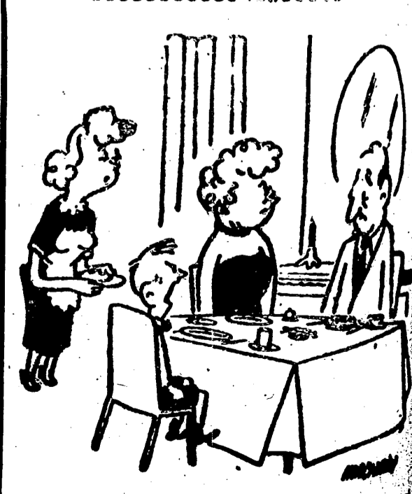
—No me gusta la nueva criada. Dí una palabra a tu jefe.—Efe.