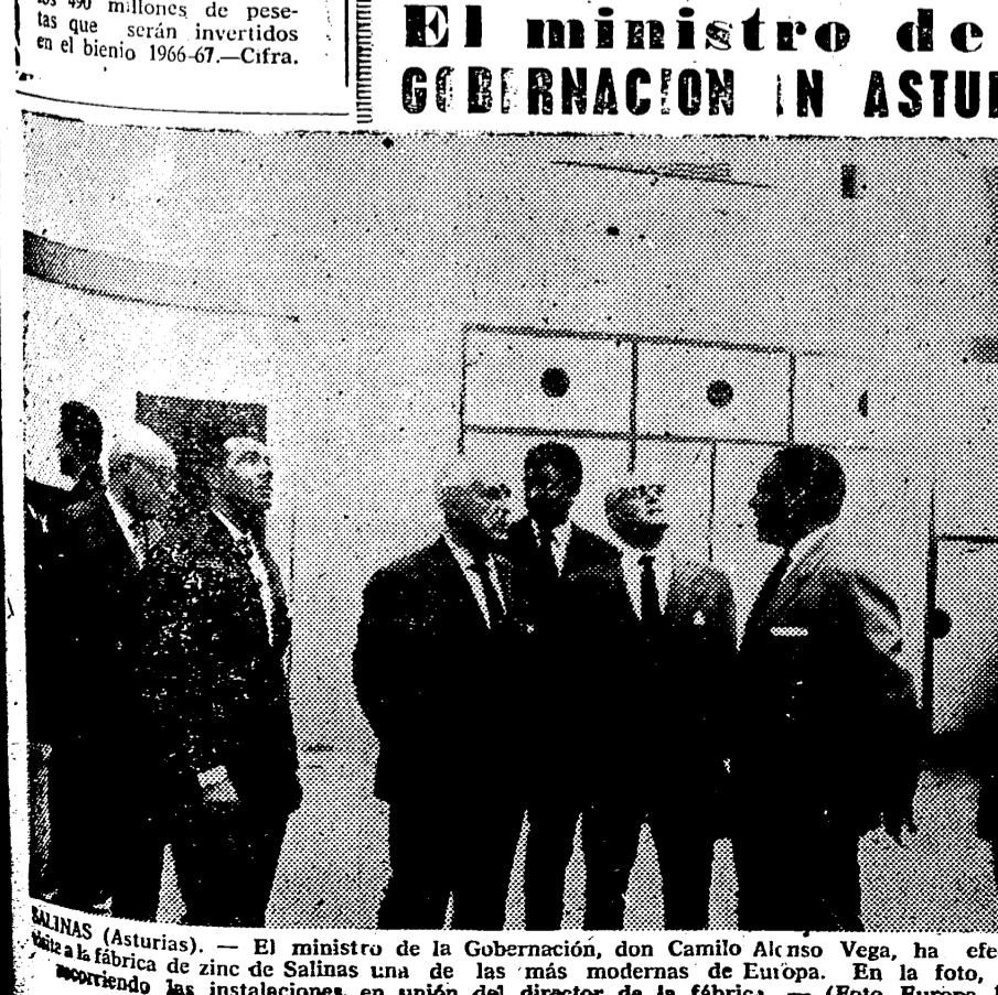
SALINAS (Asturias). — El ministro de la Gobernación, don Camilo Alonso Vega, ha efectuado una visita a la fábrica de zinc de Salinas una de las más modernas de Europa. En la foto, el ministro recorriendo las instalaciones, en unión del director de la fábrica.

DISCURSO DE JOHNSON En el discurso de aceptación de su designación como candidato a la presidencia por el partido demócrata, Johnson entre otras cosas ha manifestado que se compromete a dirigir el partido hacia la victoria en las próximas elecciones de noviembre. Pidió al partido que mantenga viva la llama encendida por el exterior. Presidente norteamericano John F. Kennedy, solicitó que los demócratas sigan llevando a cabo el programa trazado por el Presidente Kennedy y agregó que el partido demócrata ha redactado un programa para todos los estadounidenses. El Presidente Johnson ha declarado que los hombres aspiran a la consecución de la paz, pero que ésta no se alcanza por medio de la fuerza solamente, sino de la prudencia, de la paciencia y de la moderación, cualidades que han permitido la firma de un tratado para la prohibición parcial de las pruebas nucleares. Johnson ha afirmado que los Estados Unidos no cejarán jamás en la defensa de la libertad y añadió que el verdadero valor reside en la era nuclear, en la búsqueda de la paz. El primer mandatario aseguró que el partido demócrata ofrece al pueblo estadounidense la elección entre la unidad y la división entre la esperanza y el miedo.