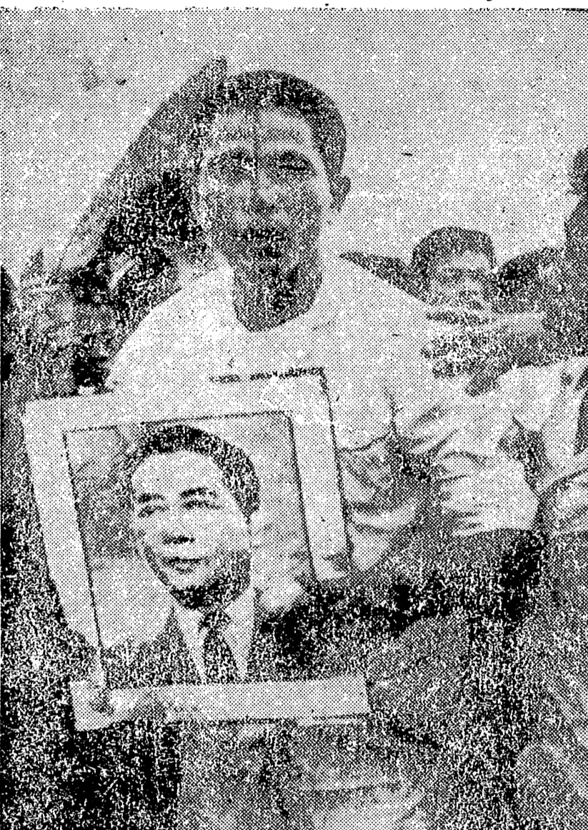
HANOI, DANANG, VIETNAM DEL SUR. — Un joven manifestante herido por un ladrillo en su mano durante las luchas religiosas entre católicos y budistas.

Gran recibimiento en La Junquera a la turista dos millones y medio que entra por dicha frontera Una estudiante irguesa de 18 años, que va a Tarragona y Salou