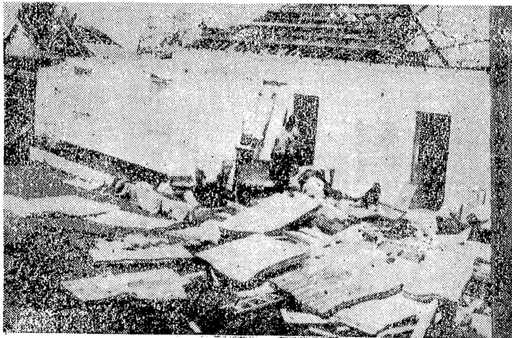
CLAYTON, 28.— Después del paso del huracán "Cleo", los habitantes de la costa sudeste de la isla de Basse Terre, han sacado a secar a sol toda la ropa que había en sus casas, también destruida por el efecto dramático del huracán.