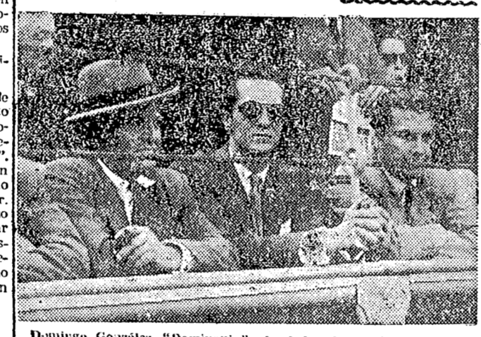
Domingo González "Dominguín", fundador de la dinastía de los Dominguín, ha muerto en su casa de Madrid hace unos días. Aquí le vemos con dos de sus hijos, fotografiados los 10 años en la plaza de toros madrileña.