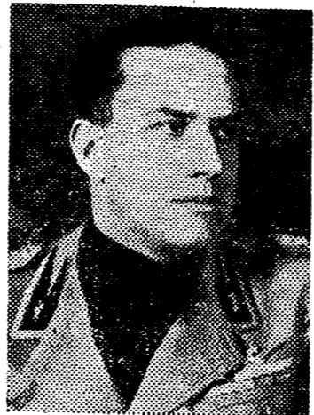
LOS QUE ACOMPAÑAN AL MINISTRO DE ITALIA