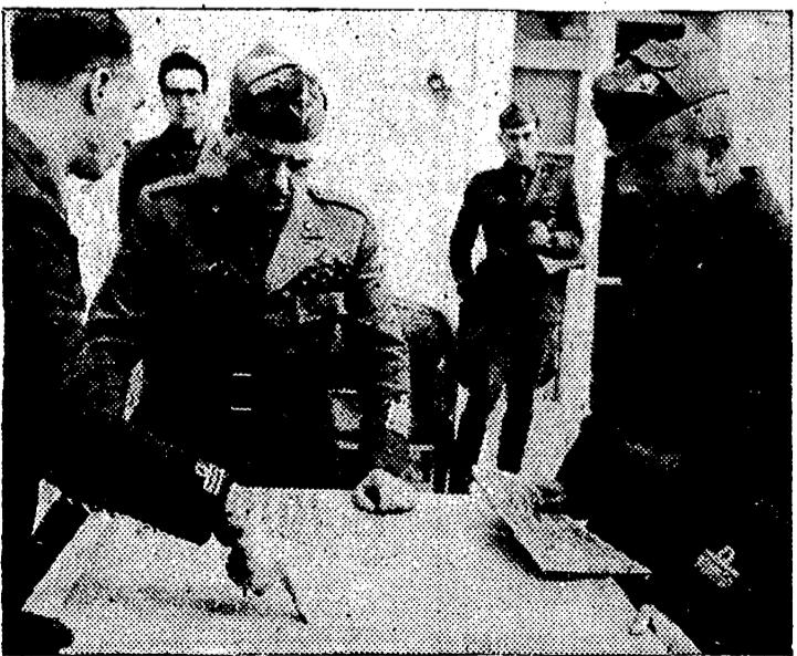
El Mariscal italiano Messe, jefe de las fuerzas que defendieron Túnez contra los aliados y que hoy luchan con éstos en Italia, examinando un mapa en el frente italiano.