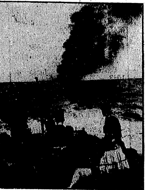
En todos los mares la Marina de guerra del Reich actúa constantemente. En la foto vemos a marineros alemanes de una unidad ligera alemana presenciendo el hundimiento de un mercante enemigo torpedeado.