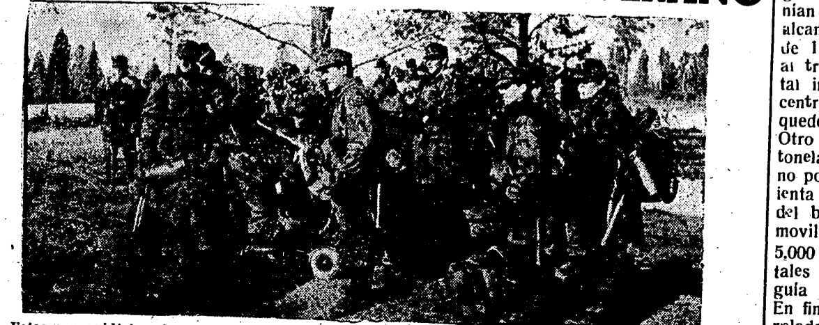
Estos paracaidistas alemanes se están concentrando en el frente. Este tal vez dispuestos para emprender muy en breve las grandes acciones de la ofensiva de verano contra los bolcheviques.

to decimena 100 gra. s número que se in- (Vicente é Ramos riéndose. publicacio- AS na excelente vieron el pi- ro. el segundo no doy pro- te billete de favor que don José. s dáselas a le ha "cu- gujetas". a la puya y gráfico ográfico re- ciudad, fue ia Carmen de Tallada, Segarra, Es- nardo Ven- Hospital gre Edo, 3 cial; Mateo 8 años, Al- n Fort Ba- Via, Villa- do, 71 años, Jaime Va- élix Brevia, ía, 89 años, Josefa Se- San Félix. cisco Vall- asco Puig; con Josefa tonio Laco- na Prats; on María Juan Dia- Beltrán Lu- Salas con la Provin- de concen- retarias de se C. Va- do, seña línea días ar aportar tan a sus LOS D número tiro en is y Fos- rada me- erza bru- el barrio menores. legos do en el ado pre- COS ombinada va, Apar- NES DE A CASA sumar araciones GRAFICA pueden porción ducción. S. Con- mófonos discos do Guz- principal- lamente a.