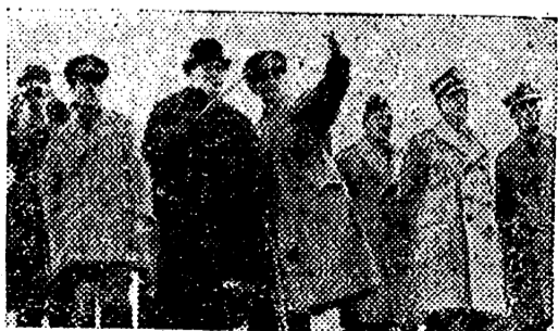
He aquí, con Mr. Churchill, a los militares de aquellos países que, con Inglaterra, «venecían» al Reich. Junto al Premier están los generales De Gaulle, Sikorski jefe del gobierno polaco, y los representantes de Holanda, Checoslavia, Yugoslavia y Grecia. No sabemos si quedará olvidado alguno de los invitados a presenciar ejercicios de defensa contra la invasión de las islas.

Aún cuando quedaron destruidos los parapetos y fortines, los soldados rojos mantuvieron la resistencia en los alojamientos. Los prisioneros han declarado más tarde que habían sido obligados a defenderse por sus oficiales que les amenazaban con sus pistolas.