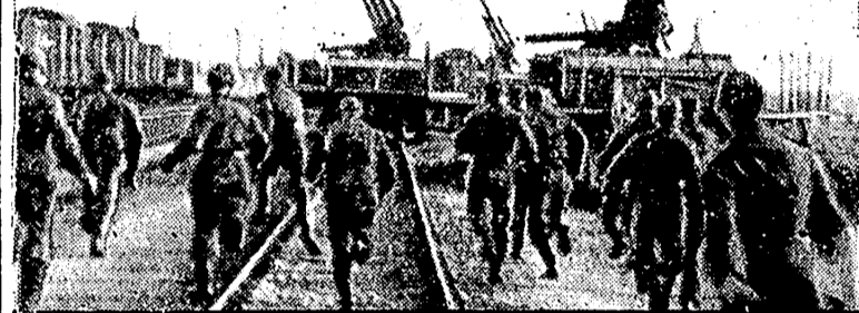
La alarma ha sonado y rápidamente los soldados corren a refugiarse en los trenes blindados mientras que otros acuden a su puesto en la defensa aérea.

Se estima que la coincidencia de la visita de Davies a Moscú con las conversaciones de los Estados Mayores en Washington demuestra el propósito de incorporar a los bolcheviques a los planes angloamericanos.—Efe.