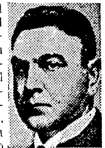
El Jefe del Estado croata

En las conversaciones participaron Ministros y Jefes militares alemanes y croatas