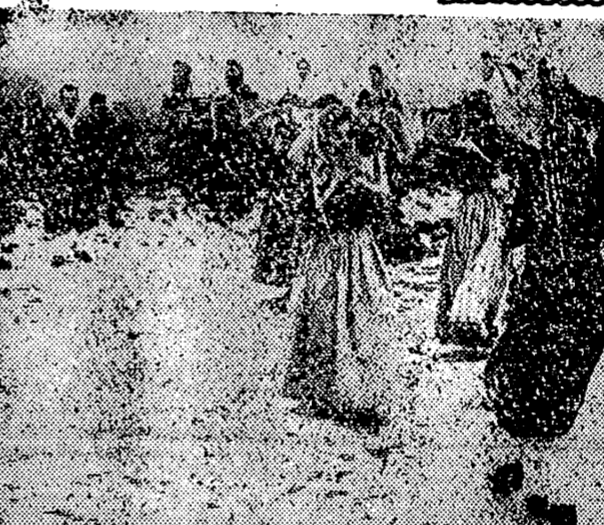
LONDRES. — Sobre el nevado suelo, el grupo folclórico mallorquín "Selva", compuesto por veintiocho miembros, interpretando una danza de aquellas islas. Dicho grupo dará una serie de conciertos en Londres y otras ciudades inglesas. La última vez que visitaron las Islas Británicas ganaron el primer premio del Concurso Internacional de Longollen.

Lluvias moderadas en gran parte de la Península