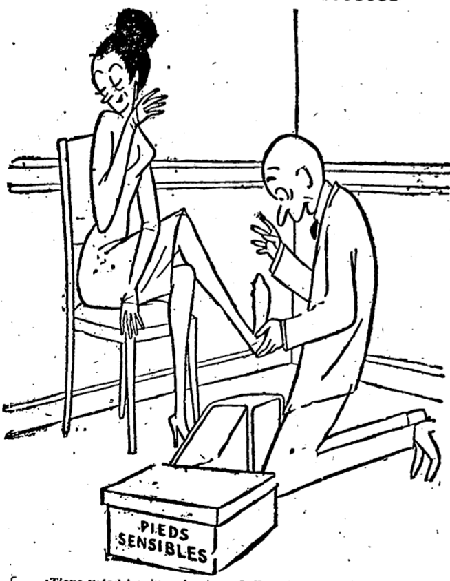
— ¡Tiene usted los jamones más bellos del mundo!