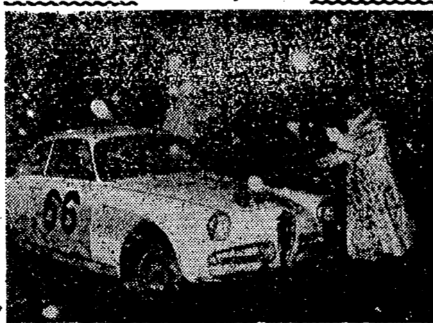
MADRID. — Una estupefacción nueva de, la primera del año, acogió a los automovilistas que participan en el famoso Rally de Montecarlo, y que tomaron la salida en Lisboa en las primeras horas de la mañana. La foto muestra la llegada de uno de los coches participantes al control establecido en el club del Real Automóvil Club de España.

Norteamérica reconoce al nuevo Gobierno provisional de Venezuela