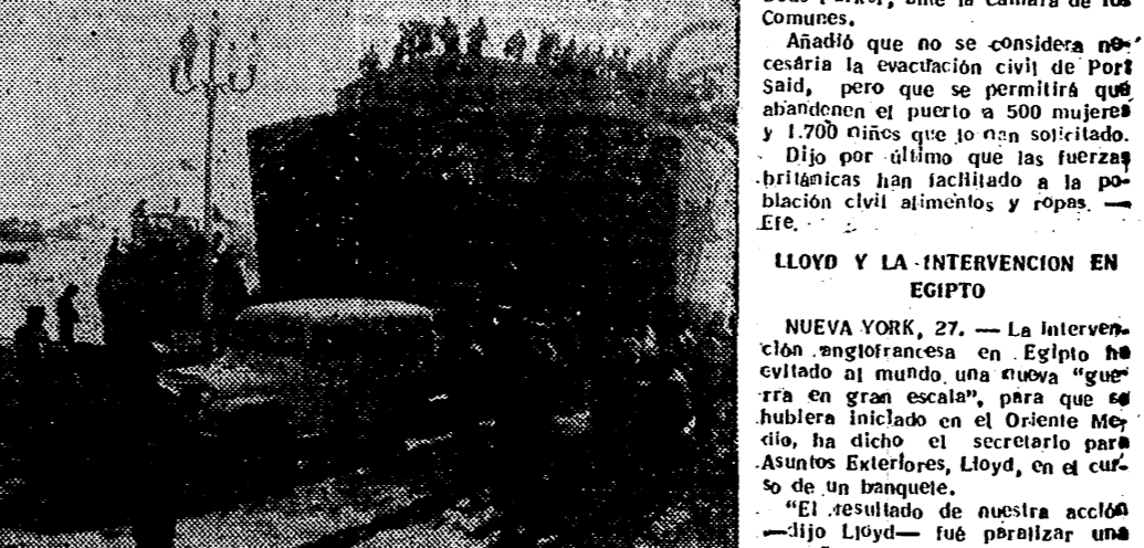
PORT SAID. — He aquí el momento de desembarcar los "Jeeps" que serán usados por los observadores de la ONU en Egipto.

LONDRES, 27. — El embajador israelí, Elath, en una breve alocución durante la cena anual de la Asociación Angloisraelí, abogó por la iniciación de negociaciones directas entre Israel y Egipto, para conseguir una paz permanente en el Oriente Medio. "Sin esto — señaló — podría producirse una situación mucho más peligrosa y grave. Creemos que en interés de todos los países amantes de la paz, que debe pensarse en la causa que motiva los constantes disturbios en aquella región. Debe ponerse fin a todo conflicto en forma constructiva, para evitar otra repetición de los acontecimientos que han provocado la amenaza actual a la paz en Oriente Medio, y al mundo entero". — Efe.