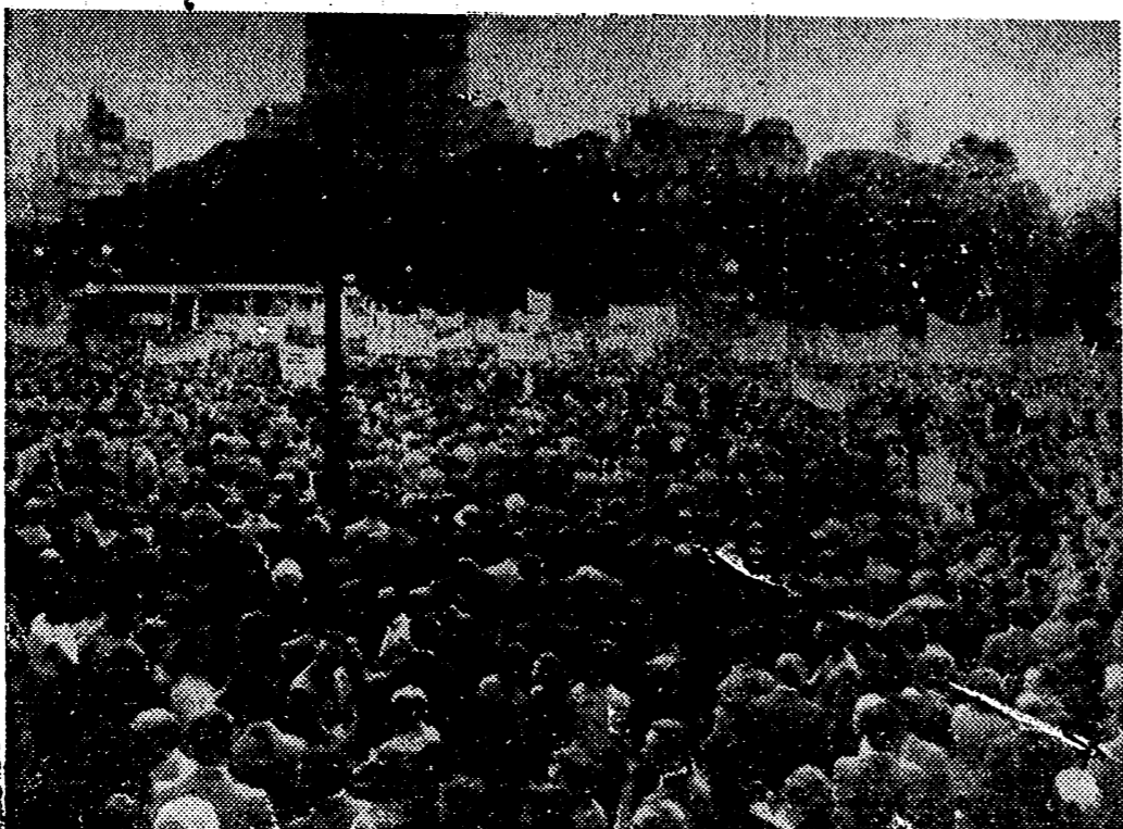
BUENOS AIRES. — Un aspecto durante la magna concentración anticomunista celebrada en la plaza de San Martín, como protesta por la intervención rusa en Hungría.