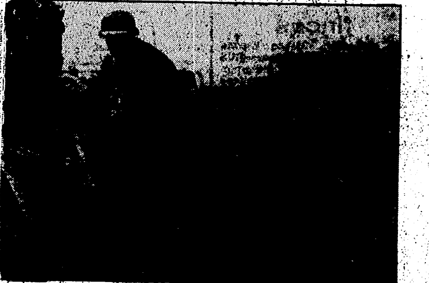
En el frente Oriental la lucha se intensifica encarnizada y los soviets lanzan continuos ataques para lograr un triunfo decisivo, sin conseguir quebrar la eficaz defensa germana. Aquí aparecen unos soldados alemanes reconstruyendo una posición poco antes perdida. — (Preservado).

NUTRITIVO COMPRANDO UVA DE ALMERIA NO SOLAMENTE AVDAMOS A UNA PROVINCIA ESPAÑOLA GRAVE- MENTE AMENAZADA EN SUS INTERESES AGRICOLAS, SINO QUE ADQUIRIMOS UN POSTRE MUNDIAL- MENTE CODICIADO POR SU IMPORTANTE VALOR.