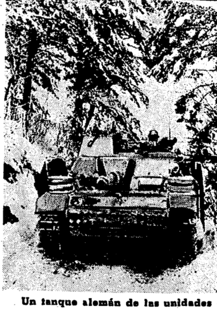
Un tanque alemán de las unidades de las órdenes del General Guderian lograron tan espectaculares éxitos en la III guerra mundial

—¿Creo usted posible llegar a una modalidad distinta de guerra: por ejemplo, a Italia en la guerra de montaña, a Francia, en el combate de unidades acorazadas, a Alemania en operaciones de infantería, etc.?