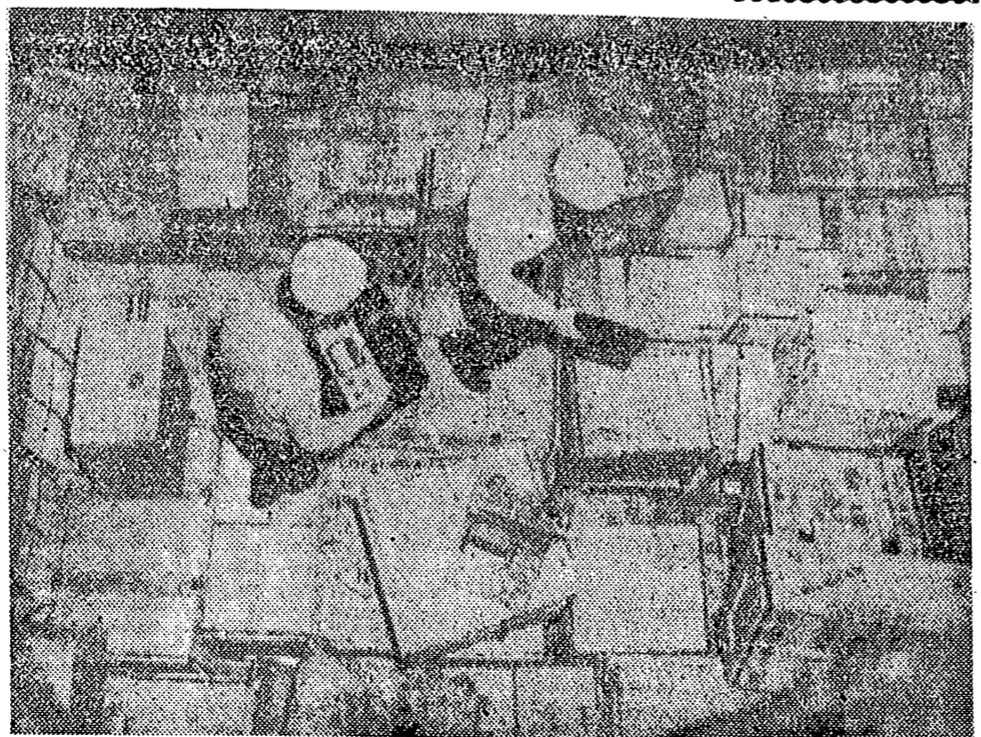
A la llegada a Nueva York, del buque noruego "Tagered" próximo del Oriente, se extendió el rumor de que el cargamento de té japonés que transportaba estaba contaminado de radioactividad. Los obreros se negaron a descargar el buque hasta que los bomberos del puerto noruyorquino, empunados con contenedores "Geiger" inspeccionaron las bodegas y aseguraron que se trataba de una falsa alarma.